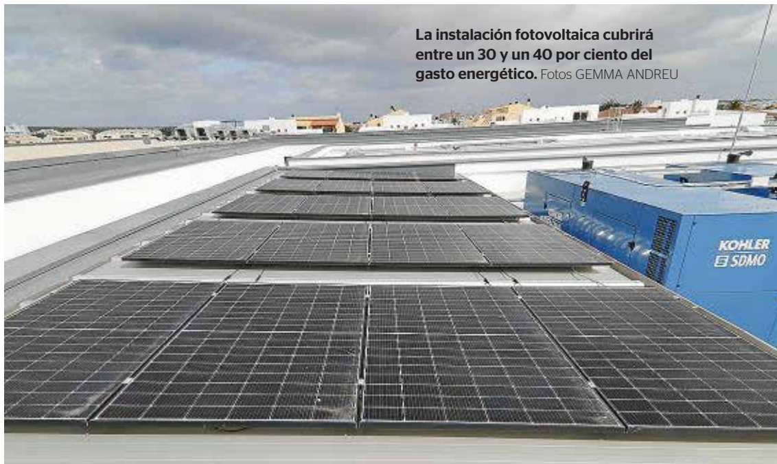
La instalación fotovoltaica cubrirá entre un 30 y un 40 por ciento del gasto energético.