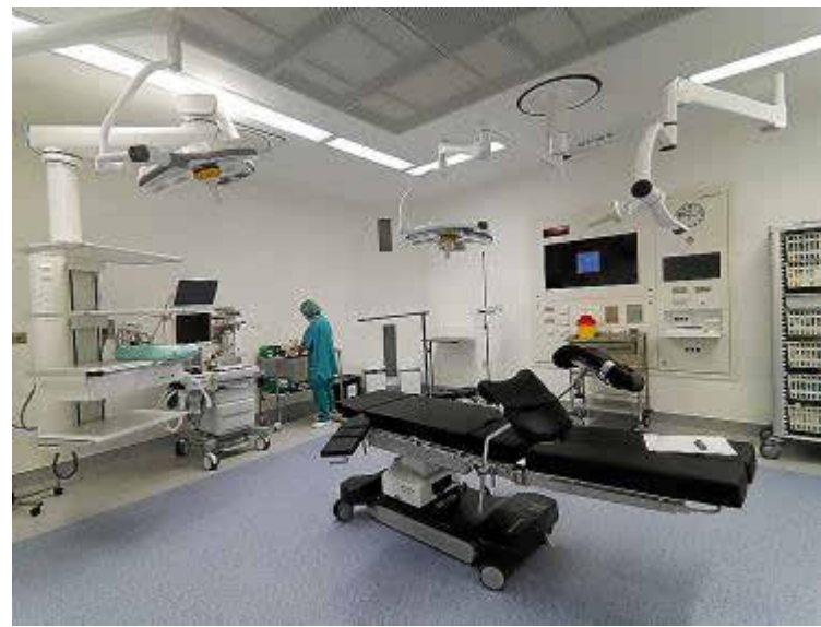
Los quirófanos se hallan en la planta baja del hospital.

5.334 metros cuadrados de superficie construida.