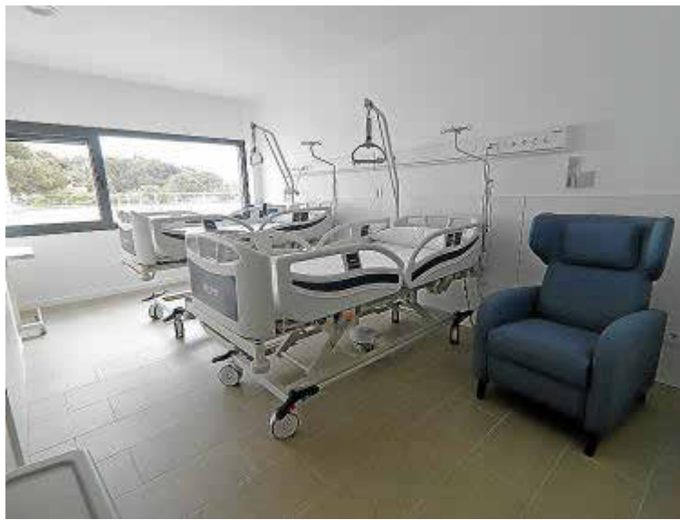
Dispone de 38 amplias y confortables camas de hospitalización.

del servicio. Además, está dotada con una sala de radiodiagnóstico digital para un tipo de pruebas muy específicas que hasta el momento requerían un desplazamiento a Son Espases o a Juaneda de Palma. «El abanico de pruebas radiológicas es mucho más elevado», indica el director. Además, la mayor precisión y calidad de imagen de la nueva maquinaria derivará en resultados mucho más precisos, con la consiguiente reducción de los tiempos de espera y una mejora en la eficiencia.