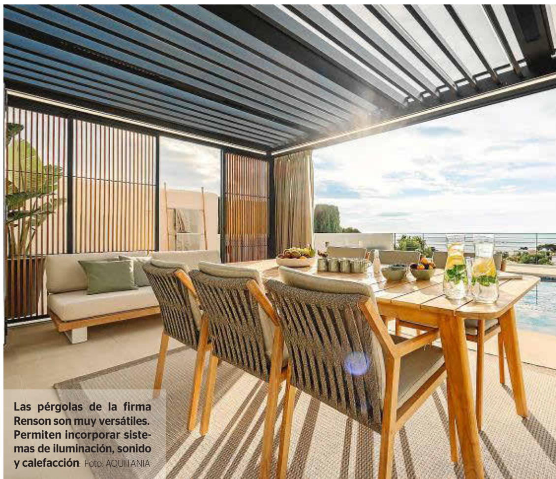
Las pérgolas de la firma Renson son muy versátiles. Permiten incorporar sistemas de iluminación, sonido y calefacción.

Aquitania ha iniciado un acuerdo de colaboración con Roselló e Hijos, una empresa mallorquina que lleva más de cincuenta años aportando soluciones para vivir mejor bajo el sol. En el caso de las pérgolas, trabajan con el fabricante belga Renson. Sus lamas del techo pueden girar hasta los 150 grados. De este modo, la cantidad de sombra y ventilación siempre puede ajustarse a las necesidades de cada momento y estación. Además, cuando las lamas están cerradas repelen el agua y tras un chaparrón, además de no mojarse, el agua acaba evacuándose a través de un sistema integrado de drenaje. Dispone, asimismo, de innumerables elementos para personalizar este espacio y convertirlo en un acogedor resguardo. Es posible elegir cortinas de exterior que combinan con el estilo de su hogar u optar por un estor resistente al sol y al viento con una ventana de cristal para conservar unas vistas perfectas. Puede integrarse un sistema de iluminación o incluso de sonido, así como calefacción. Su pérgola se convertirá en el lugar favorito donde relajarse.