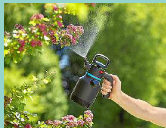
Todo para el exterior. En Apalliser cada nueva temporada se esfuerzan en presentar las mejores ideas para proyectar una nueva mirada con la que poder dar vida a tu terraza y disfrutar de ella.