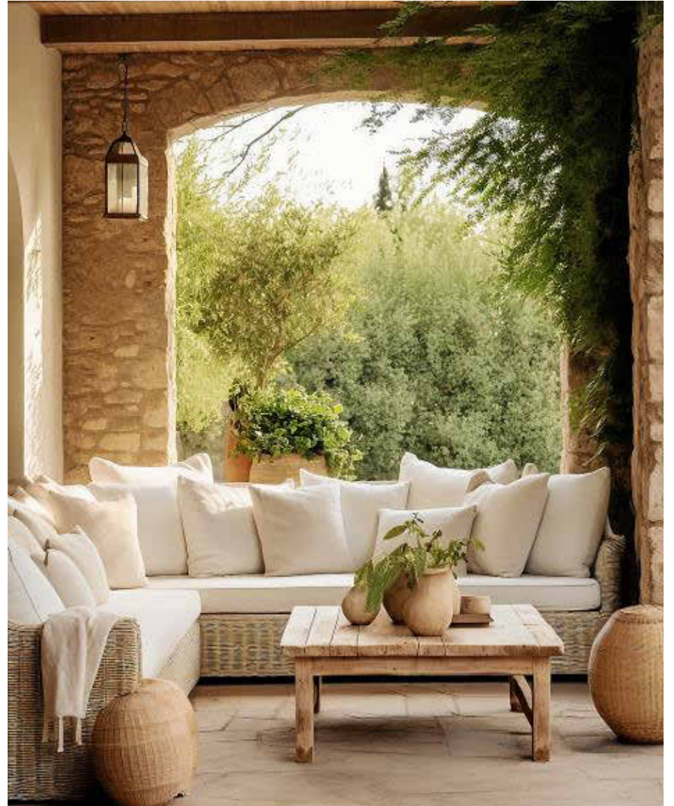
Las zonas exteriores de nuestros hogares establecen un claro nexo con la naturaleza.