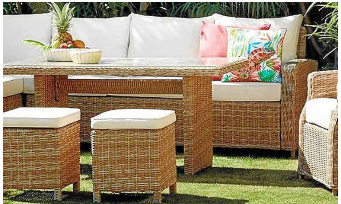
Natural. Tonislar apunta que la tendencia natural y rústica predomina, especialmente en terrazas, patios, porches y jardines del interior de la Isla. Además, recomienda toldos y pérgolas.

En cuanto al estilo, en Tonislar apuntan que esta tendencia natural y rústica predomina especialmente a la hora de decorar las terrazas, patios, porches y jardines del interior de Menorca. En cambio, los espacios