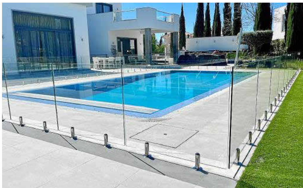
Protección. Las vallas de Around Pools Menorca están disponibles en tela de varios colores, así como en cristal, adaptándose a las preferencias de cada cliente.

El material utilizado permite ver al otro lado, un elemento añadido a la ansiada seguridad. Además, el sistema cuenta con una puerta de cierre y pestillo automático que, a su vez puede cerrarse con llave. Son vallas fácilmente desmontables que se adaptan a cada necesidad y momento.