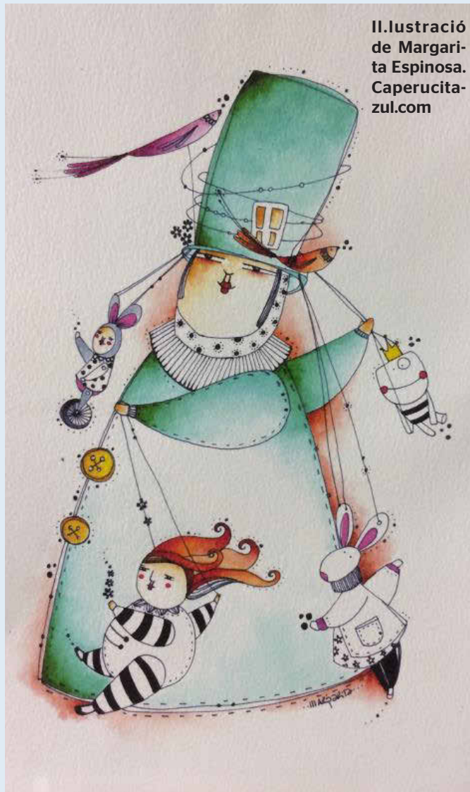
Il·lustració de Margari-ta Espinosa. Caperucita-zul.com

Ens veurem prest. I no patiu per les notes del curs. Ara toca aprendre. El vostre profe de català. Ciutadella de Menorca, 16 d'abril de 2020.