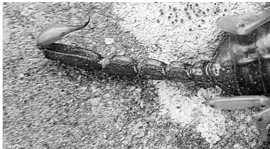
Coa. Acaba amb un fibló capaç d'injectar verí (tèlson).

que la presa s'hi apropi, i llavors la capturen amb les pinces i li claven l'agulló. El verí de les nostres espècies és poc potent, de manera que basen l'estratègia de caça en la força de les mordales abans que en la seva letalitat química. És cert que a altres indrets hi ha escorpins amb picadures molt perilloses per a nosaltres, fins i tot mortals, però les d'aquí no tenen més complicacions que la picada d'una vespa. I a més només piquen si es senten amenaçats. Per menjar-se les preses, les líquen injectant-les enzims digestius amb els quelícers, i després les xuclen.