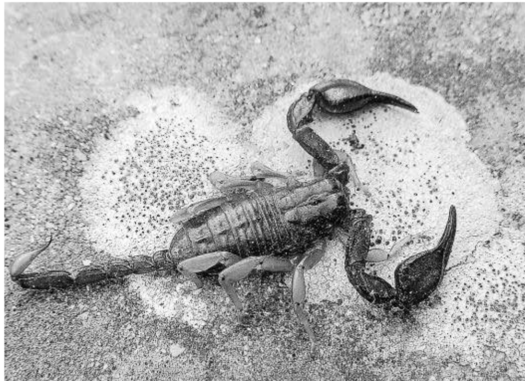
Aspecte. Coneguts per la seva anatomia, els escorpins estan emparentats amb les aranyes.

L'escorpí negre viu solitari a enfons, sota pedres o a racons humits de les cases, com els soterranis. La seva activitat és nocturna. Cacen tot tipus d'animalons que troben a aquests ambients, com paneres, cinquanta-cames, someretes de bolla, o altres escorpins! Cacen a l'aguait, esperant