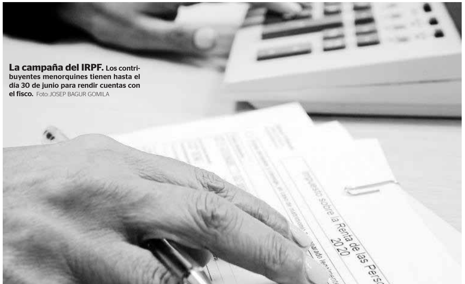
La campaña del IRPF. Los contribuyentes menorquines tienen hasta el día 30 de junio para rendir cuentas con el fisco.

Pero la realidad será bien distinta. Por ello, la Agencia Tributaria ha diseñado un refuerzo de la asistencia personalizada en esta campaña, tanto para la resolución de dudas como para la confección de la declaración. Además, Hacienda está enviando cartas informativas a perceptores de prestaciones por ERTE que pasen a ser