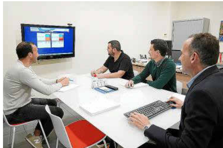
Cecome Sant Lluís presta servicios profesionales a empresas de Balears y Catalunya.