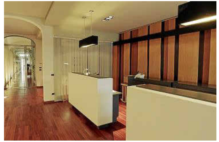
Imagen de las oficinas de la asesoría MRabasa Consulting.