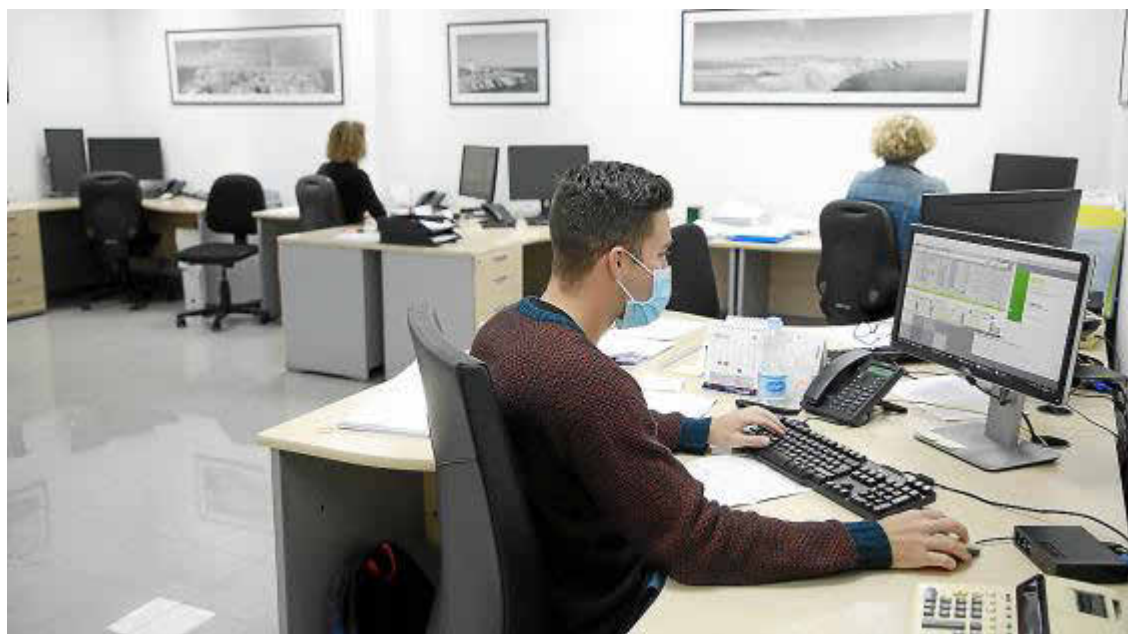
Centre Càlcul Ciutadella cuenta con profesionales en continua formación.

► Los técnicos prevén un incremento de las citas para la elaboración de una renta atípica