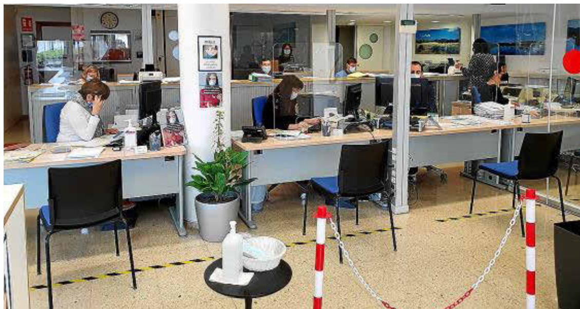
Imagen de las oficinas de la Gestoría Mantolán adaptadas para una atención segura frente a la covid.

► La Gestoría Mantolán recomienda acudir a un experto en un año fiscal de lo más complejo