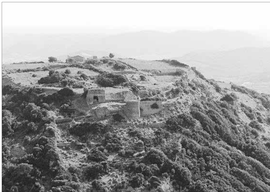
Els menorquins musulmans van capitular davant Alfons III d'Aragó el 21 de gener de 1287 al castell de Sen Agayz.

Aquell rei, fill major de Pere III d'Aragó i de Constança de Sicília, va emprar les cavalleries menor-