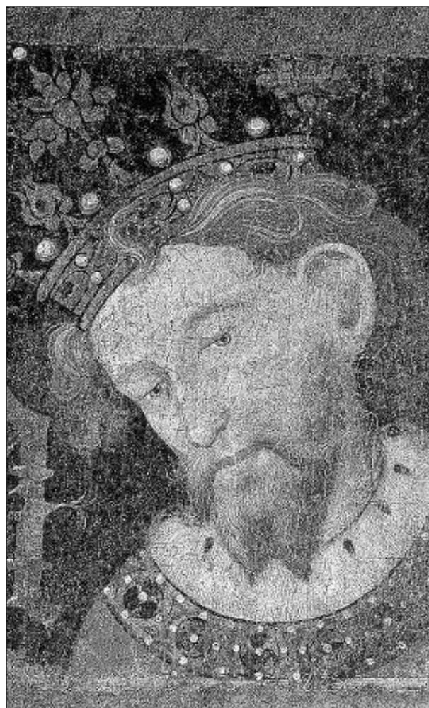
Alfons III d'Aragó, conegut com el Liberal i el Franc (València, 1265-Barcelona, 1291) ordenà la conquesta de Menorca.

I Abu Umar Ben Hakam, el darrer rais de Menorca, home culte, escriptor i poeta, morí el 1288 en un naufragi a la costa de Tunísia.