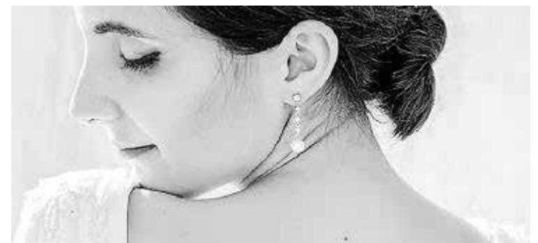
Joyería Vinent es un referente en todo tipo de joyas.