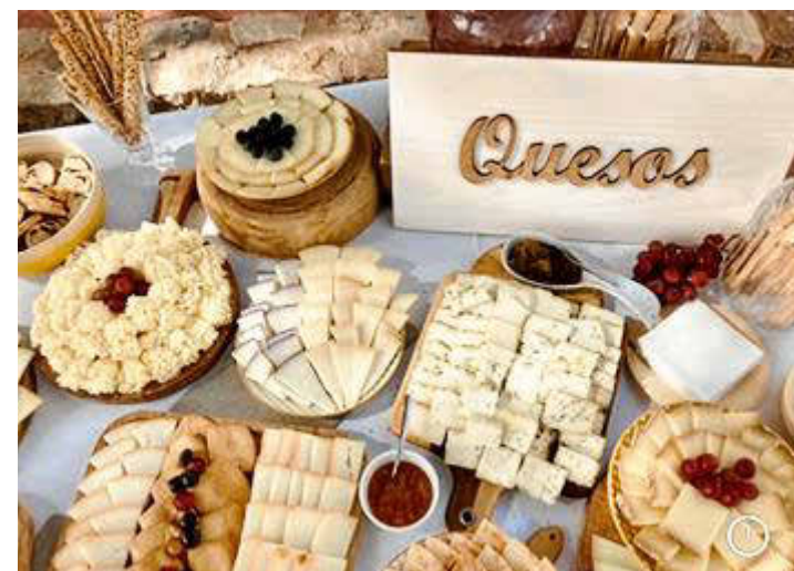
El Paladar está especializado en organización de eventos.