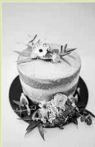
Imágenes que muestran la destreza pastelera de Claudia Bruder, de Floreti.