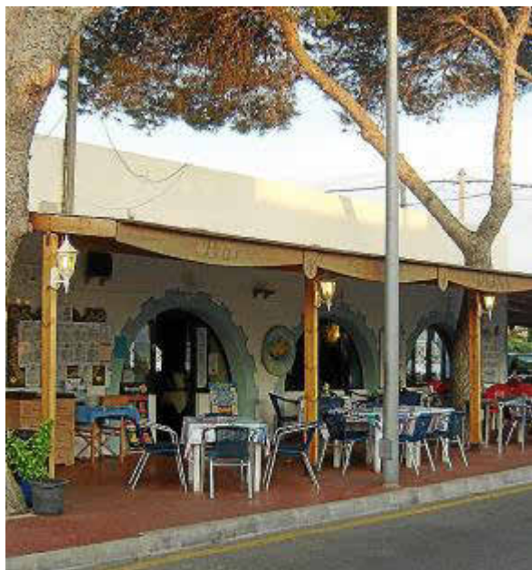
El Restaurant Pons ofrece un ambiente familiar.