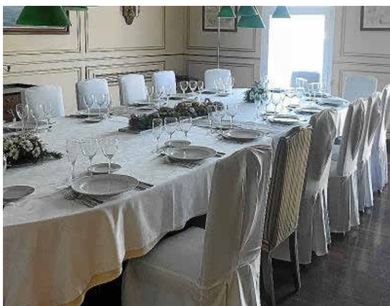
Los salones de La Minerva permiten distintos tipos de eventos.