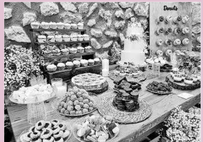
Tartarita's es un obrador ubicado en Maó especializado en repostería creativa y preparación de mesas dulces.

cada vez más asentada tendencia del nude para los pasteles en los que se ve el bizcocho y cuyo toque mediterráneo llega de la mano de flores, eucalipto u olivo. Otra de las especialidades de Tartarita's son las mesas dulces en las que no faltan los vasitos, los minidonuts y los cupcakes.