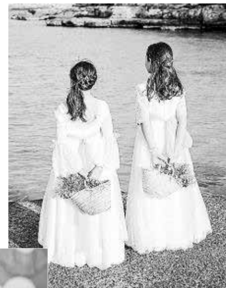
Trabajos de fotografía familiar realizados por Cristina Barber Fotografía .

Su trabajo destaca por la comodidad y la proximidad que traslada a sus clientes, a lo que hay que añadir el objetivo de hacer de la sesión un momento de diversión familiar. Además de 'regalar' un momento mágico a la familia, también le permite