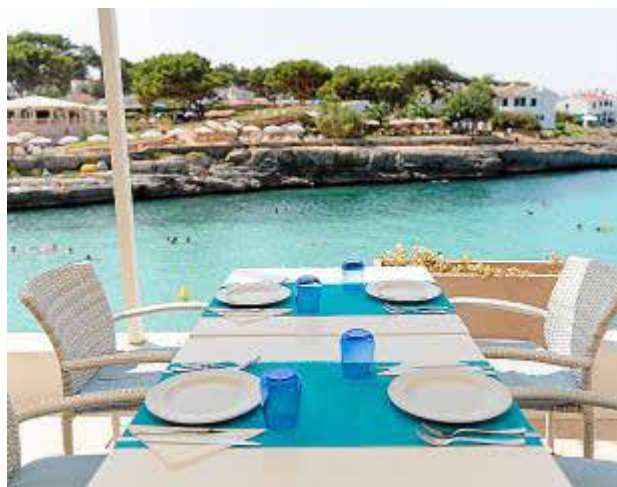
El Restaurante Miramar ofrece unas vistas espectaculares a Cala Blanca.

Restaurante La Minerva es un local emblemático con unas fantásticas vistas al puerto de Maó. Sus 28 años de experiencia en el sector de la restauración y en la organización de eventos garantiza el éxito de la elección. En cuanto a espacios, pone a disposición tanto comedores privados como grandes salones para