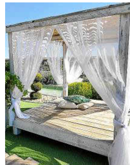
Decoraciones de Las Telas de Belén.

Son demandadas telas como el tul blanco, de visillo o de saco para decorar estos espacios. Desde Las Telas de Belén apuntan a arcos de madera repletos de flores en los que una tela de tul ondea a ritmo de la brisa del viento o balas de paja que actúan como asientos o mesas y que precisan de un tapete o mantel para darles su toque más chic. También se solicitan telas para decorar sillas o para elaborar toldos, entre muchas otras opciones.