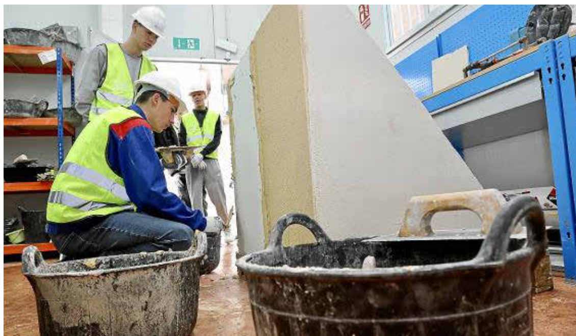
Imagen de la jornada de puertas abiertas celebrada a mediados de abril en la sede de Es Mercadal.

► La Fundación Laboral de la Construcción en Balears apuesta por la formación e incorporación de este colectivo en puestos de obra