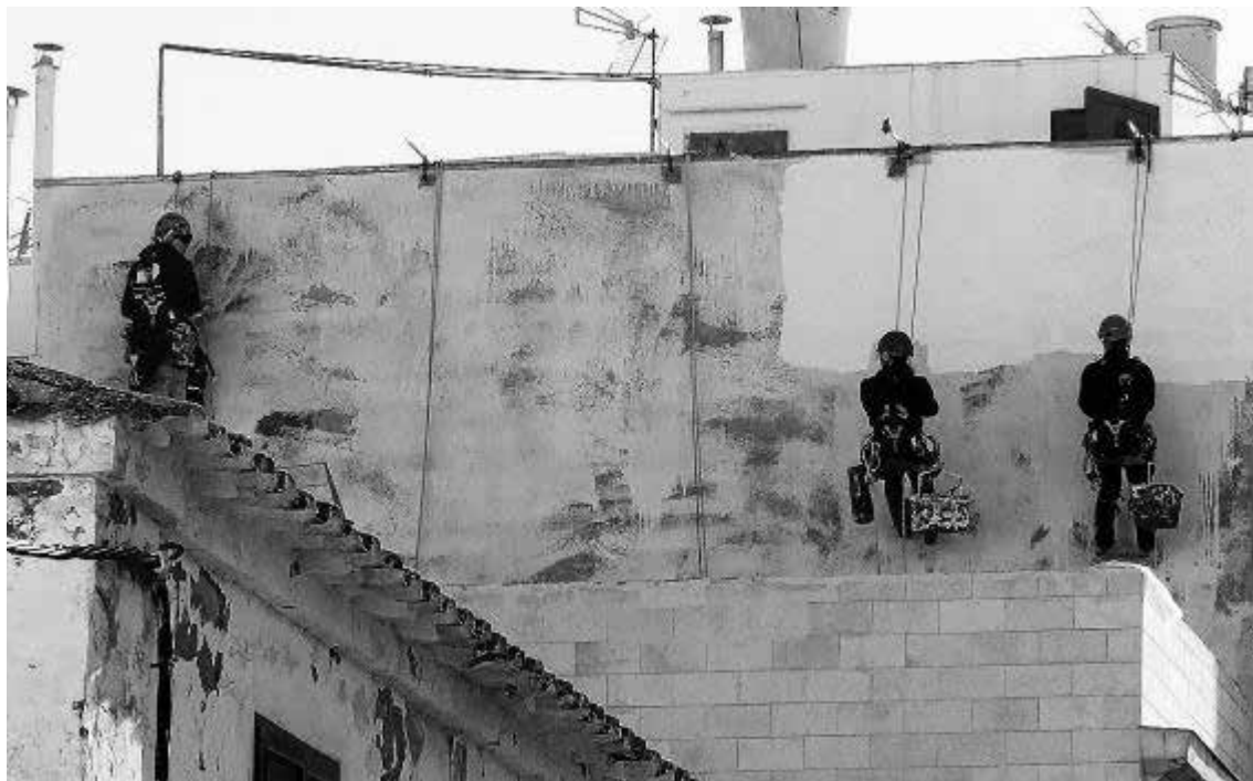
Tres pintores ataviados con elementos de seguridad para ejecutar un trabajo en altura.