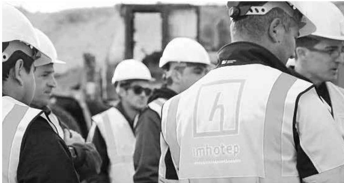
Imhotep desarrolla un amplio programa formativo para ofrecer las herramientas y reducir riesgos.

► Imhotep Prevenció cumple 20 años de actividad acompañando a las empresas a ser más seguras, eficientes y saludables