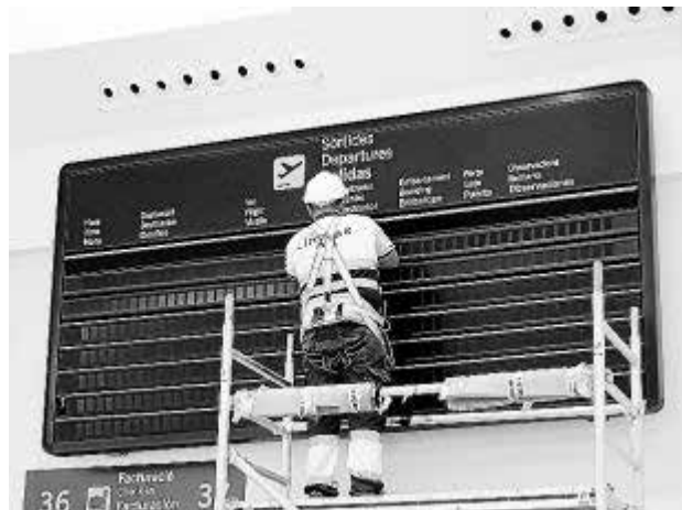
Toda empresa debe cumplir con la prevención.

Aquellas empresas o autónomos que tengan hasta 10 trabajadores (o 25 si se hallan en un mismo centro de trabajo) podrán ocuparse de organizar la prevención siempre que las actividades que se realizan no