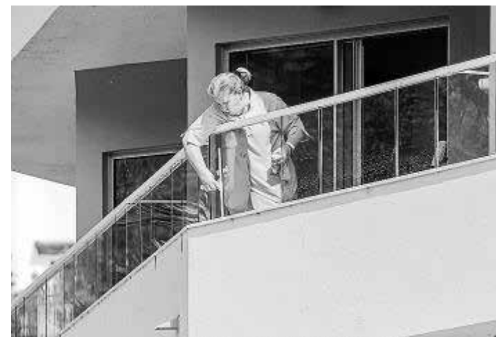
Una empleada limpiando los cristales de un hotel.

La directora general de Trabajo, Catalina Cabrer, indica que «todos tenemos claro que esta temporada tienen que quedar listos los estudios de carga de trabajo de las camareras de pisos, luego se extenderá a otros colectivos, como el personal de cocina». Valora muy positivamente las jornadas de información y formación organizadas por las diferentes federaciones hoteleras en colaboración con el Ibassal.