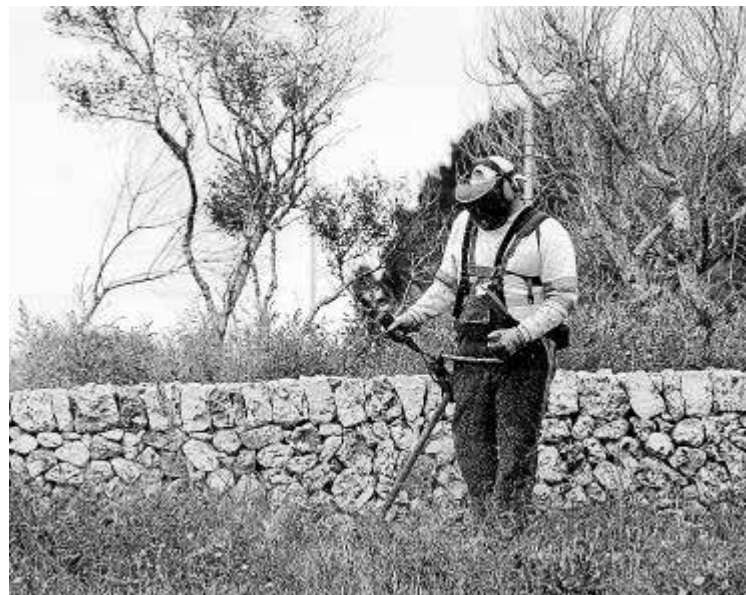
Un ejemplo de prevención de riesgos en el trabajo.

Desde que en el año 2000 se implantó el servicio, cada año se han ido desarrollando actuaciones relacionadas con el asesoramiento, difusión, promoción, in-