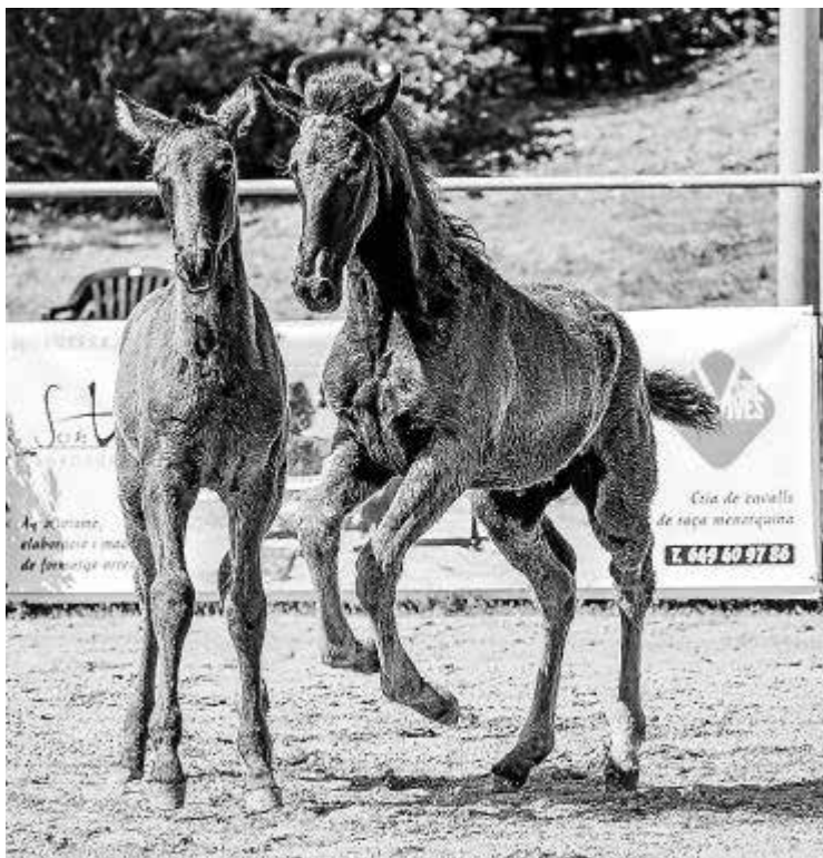
La escasez de ejemplares domados hace subir el precio.

Ya hay cerca de 1.600 ganaderas con un tamaño medio por ganadería de 2,45 cabezas. Cada año se registran un promedio de 125 nuevos ejemplares y hay programa de cría reconocido en multitud de países. La intención de la Asociación de Criadores y Propietarios de Caballos de Raza Menorquina es que esa expansión no se detenga. Dar visibilidad de la raza en el extranjero es uno de los grandes objetivos de la Fira del Cavall que hoy arranca en el recinto ferial de Es Mercadal y a la que asistirán, con el apoyo de la Fundació Foment del Turisme de Menorca, periodistas especializados de países tan cercanos como Portugal, donde to-