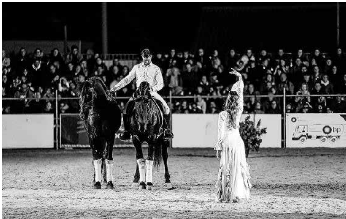
De película. El espectáculo ecuestre es una de las citas más esperadas de la Fira del Cavall. Este año el cine tendrá una presencia relevante, con un número al son de canciones clásicas del género del lejano oeste. El evento de mañana viene lleno de sorpresas.

Las ganas de sorprender al público hacen que la información sobre el espectáculo se vaya dando con cuentagotas. Se pueden dar pinceladas: habrá un número dedicado a una película muy famosa, otro a un videoclip muy popular en su tiempo, otro dedicado a un cuento y uno que se ha preparado con mucho mimo con músicas dedicadas al género cinematográfico del western . Todos