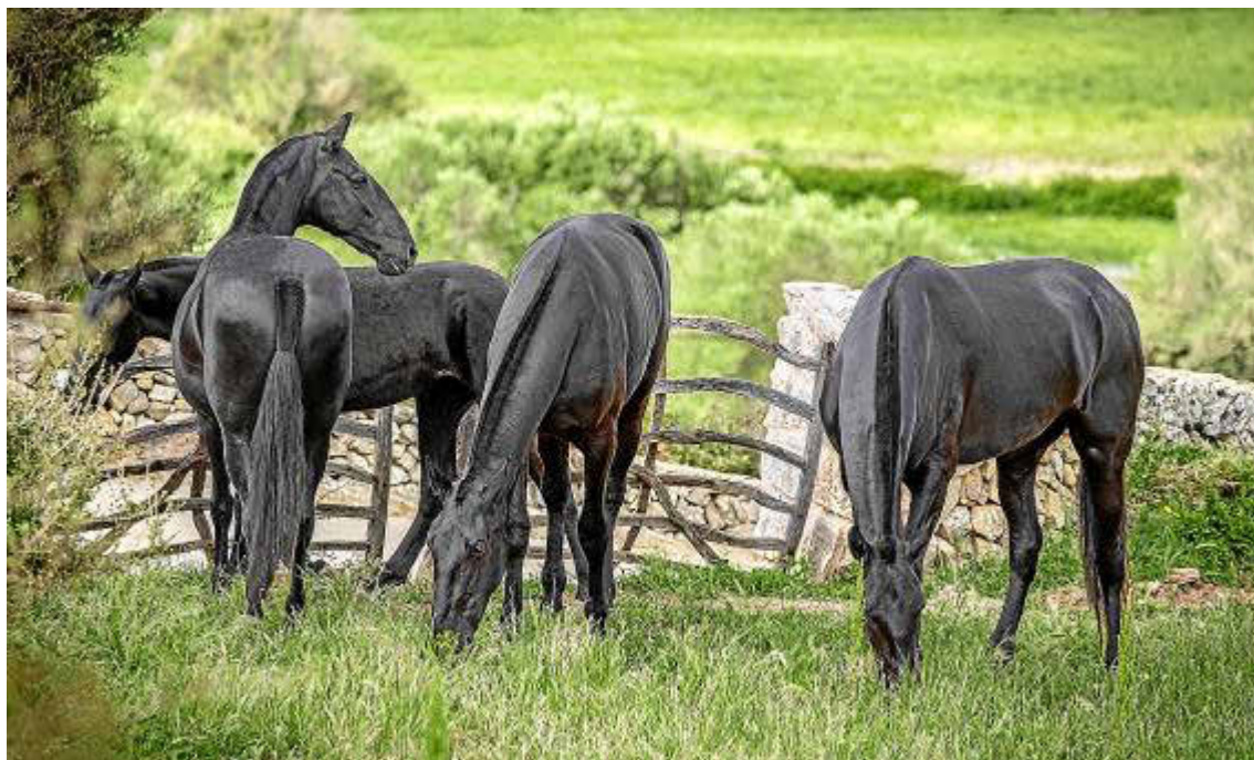
El caballo de raza menorquina es cada vez más valorado en el extranjero.