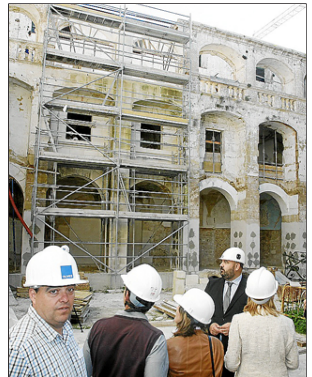
El conseller Martínez visitó ayer las obras.

► La reforma, parada en 2012, se retomó el año pasado y prevé concluir a finales de 2015