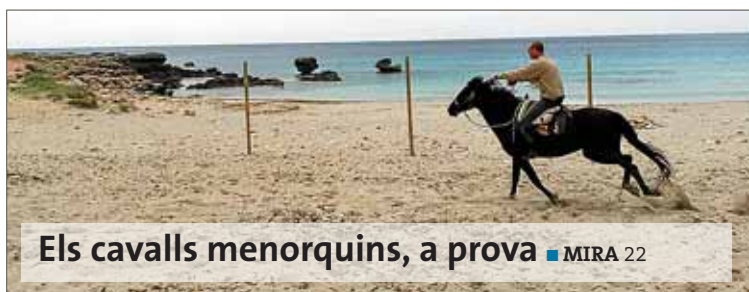
Els cavalls menorquins, a prova ■ MIRA 22